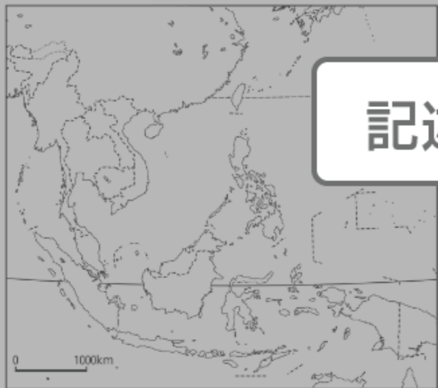
東南アジアの白地図

マレーシアに関する書籍やウェブサイトなどを参考にして、下の図にマレーシアに関する基本情報を書き込もう。