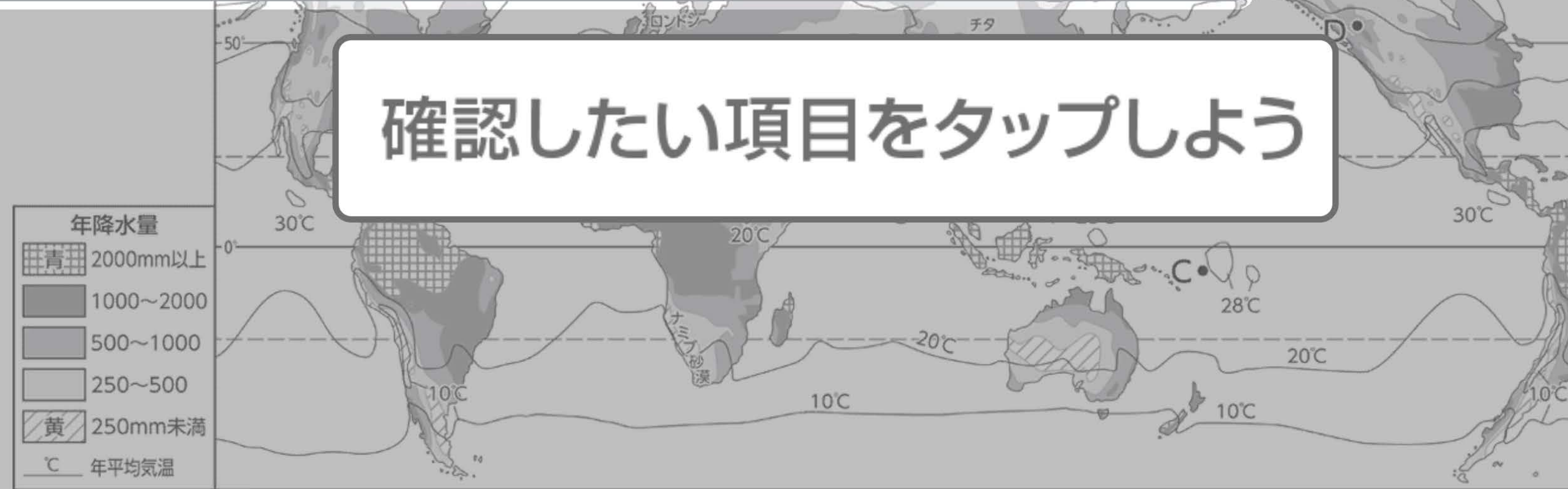
世界の年平均気温・年降水量